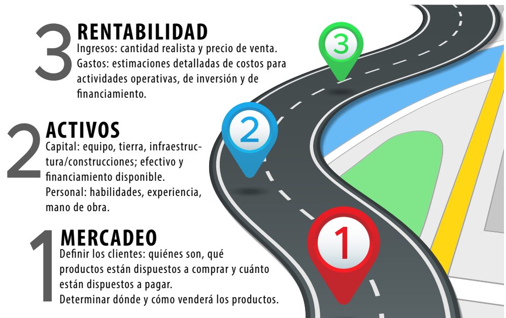
Figura 3. El MAR del Plan de Negocios muestra tres categorías principales en el proceso de planificación.