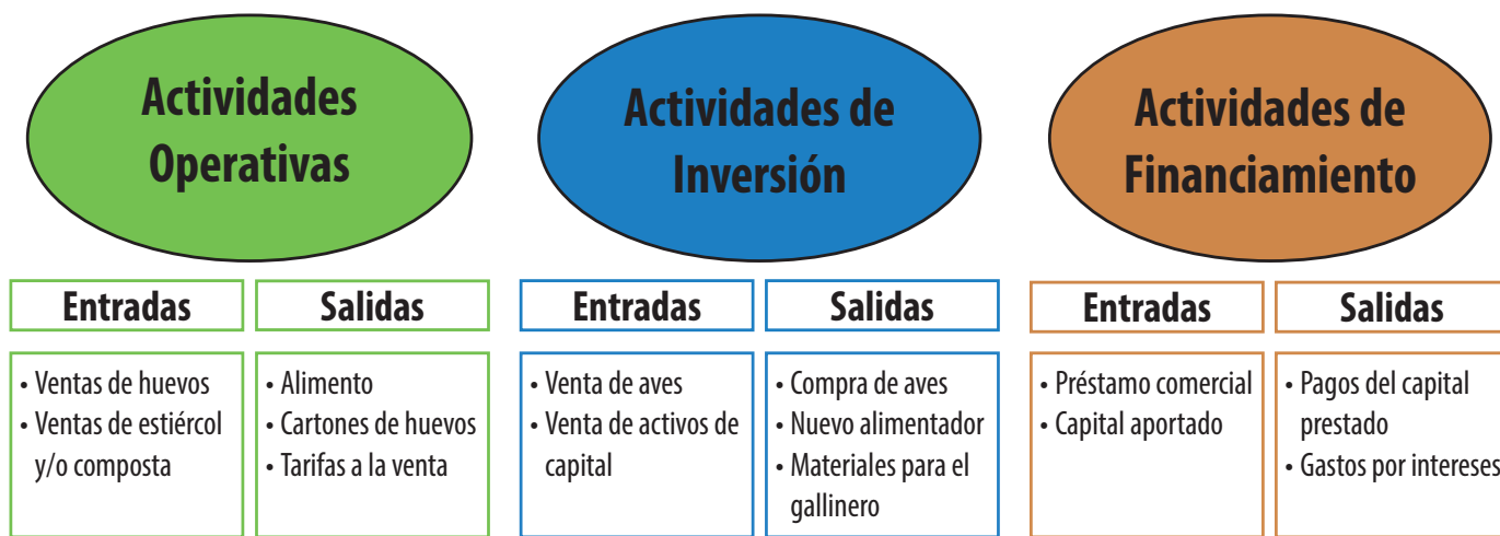
Figura 4. Ejemplos de categorías de flujo de efectivo para una empresa de venta directa de huevos.