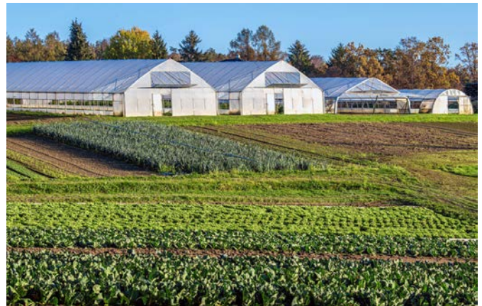
Figura 1. Un tercio de las granjas en Missouri tienen menos de 50 acres.

Los propietarios de parcelas pequeñas pueden iniciar empresas agrícolas para convertirlas en una fuente principal de ingresos. Otras razones por las cuales los propietarios desarrollan nuevos negocios incluyen la diversificación de la granja, ingresos complementarios, manejo de tierras, autosuficiencia, gratificación y estilo de vida.