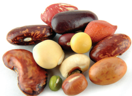
Los frijoles son una buena fuente de fibra.

Hay muchos alimentos nutritivos que pertenecen al grupo de alimentos proteicos. La mayoría de la gente piensa que los alimentos proteicos son nada más la carne, el pollo, el pescado y los huevos. Estos si son excelentes fuentes de proteínas, vitaminas y minerales. Pero también hay varias opciones en las plantas incluyendo nueces, semillas, frijoles y alimentos de soya. Es importante elegir una variedad de alimentos ricos en proteínas para que podamos obtener variedad de nutrientes.